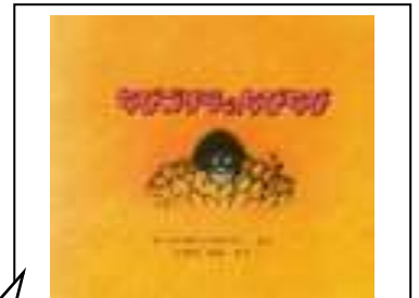
「ちびゴリラのちびちび」 ルース・ボーンスタイン:作 いわたみみ:訳/ほるぷ出版

子どもはとっても知りたがり屋です。見た事をやってみます。大人は、子どもに見られていますよ！